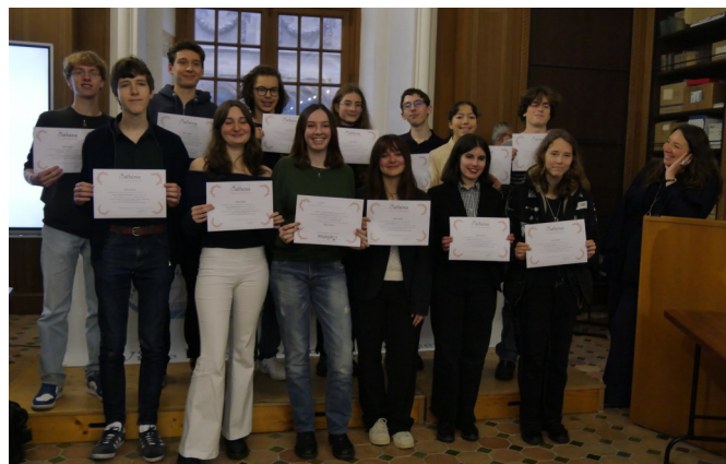
Les lauréats lycéens 2023

Le palmarès de chaque concours et les meilleures copies peuvent être consultés sur notre site à la Rubrique « L'association » puis « Concours », puis « Historique » de chacun des concours et « Concours 2022-2023 ».