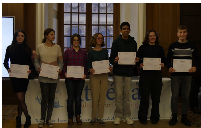
Les lauréats collégiens 2023

La cérémonie s'est terminée en félicitant à nouveau les lauréats, autour de quelques gâteaux et verres de jus de fruit.